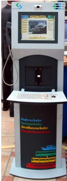
Abbildung 3: Öffentliches Nutzerterminal

Mit dem Start des Videoberatungssystems standen dem Nutzer 4 öffentliche Terminals zur Verfügung, welche von einem Beraterterminal bedient werden. Weil sich die praktische Funktionsfähigkeit des Gesamtsystems erst bei dem Einsatz von mindestens 2 Beraterterminals herausstellen wird, werden 2003 ein weiteres Beraterterminal und 10 zusätzliche Nutzerterminals installiert. Bis Ende 2003 ist geplant in der Region Dresden über 200 solcher Terminals zu installieren, wobei die Anzahl der Beraterterminals an den aktuellen Bedarf angepasst wird.